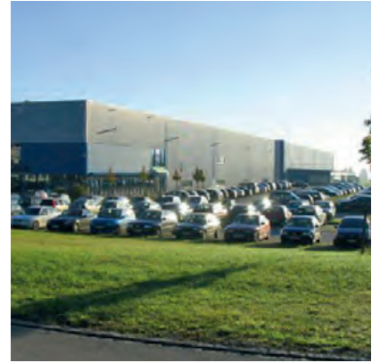
Blick auf den Fossil Eurodome

Seit 1988 ist das aus Dallas (Texas) stammende Unternehmen FOSSIL auf dem deutschen Markt aktiv. Zu den eigenen Marken gehören FOSSIL, MW MICHELE und ZODIAC. Unter Lizenz vertreibt FOSSIL außerdem renommierte Marken wie ADIDAS, BURBERRY, DIESEL, DKNY oder EMPORIO ARMANI. Das Produktspektrum umfasst ein umfangreiches Schmucksortiment mit Uhren, Ringen, Halsketten, Armbändern und Ohrringen. Hinzu kommt ein großes Angebot an Lederwaren mit Accessoires und Taschen in verschiedenen Variationen. Kleidung wie Schuhe, Jeans und Blusen runden das Angebot ab.