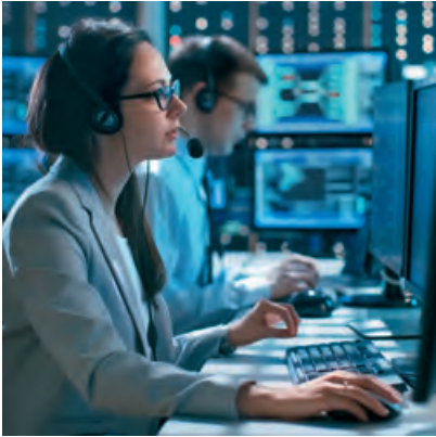
Immer alles im Fokus – mit dem KDL Service Manager.