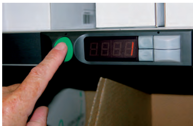
Quittungstaster einer Pick by Light-Anlage