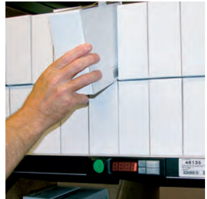
Signallampe mit einem alphanumerischen Display.

Pick by Light (Deutsch: „Kommissionieren nach Licht“) gehört zu den beleglosen Kommissionierverfahren. Anstelle einer Kommissionier- oder Pickliste werden dem Kommissionierer die zu pickenden Artikel und Mengen über eine direkt am Entnahmefach angeordnete Fachanzeige übermittelt.