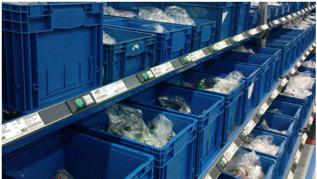
Kleinteilelager mit Pick by Light- Vorrichtung