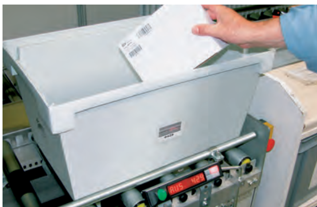
Kommissionierbehälter an der Pickposition