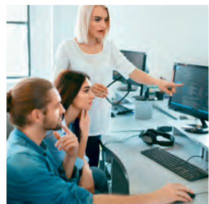
KSM: Datengrundlagen jederzeit selbst in der Hand haben.