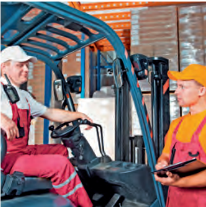
Verbindung mit Vertrauen: Das Staplerleitsystem von KDL im Einsatz.

Ein Staplerleitsystem (SLS) ist ein Logistiksystem, das den Einsatz von Flurfördergeräten, insbesondere Gabelstaplern, steuert. Die Aufgabe des Systems ist es, die Aufträge und dafür vorgesehene Routen möglichst optimal zu vergeben und damit unproduktive Leer- und Suchfahrten zu verhindern. Durch den richtigen Einsatz eines Staplerleitsystems kann die Auslastung der Stapler optimiert und dadurch ein Gewinn an Effektivität erzielt werden. Zu einem Staplerleitsystem gehören eine zentrale Steuereinheit sowie in der Regel über Funk verbundene, mobile Terminals für die Fahrzeuge. Es kann Teil eines Lagerverwaltungssystems sein oder ein eigenständiges System, das daran angeschlossen ist.