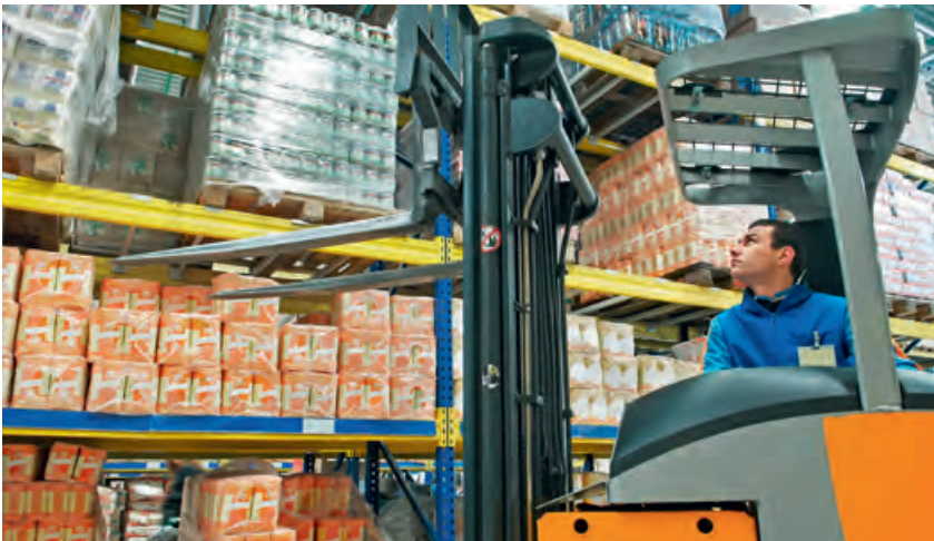
Das Staplerleitsystem von KDL: Mehr Effizienz bei den Routinen des Arbeitsalltags.