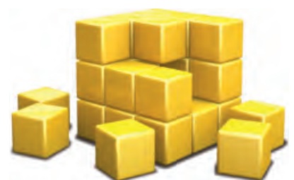
KDL Logistik Consulting